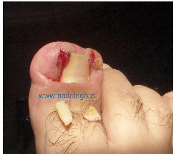
Tratamiento de Urgencia Onicocriptosis