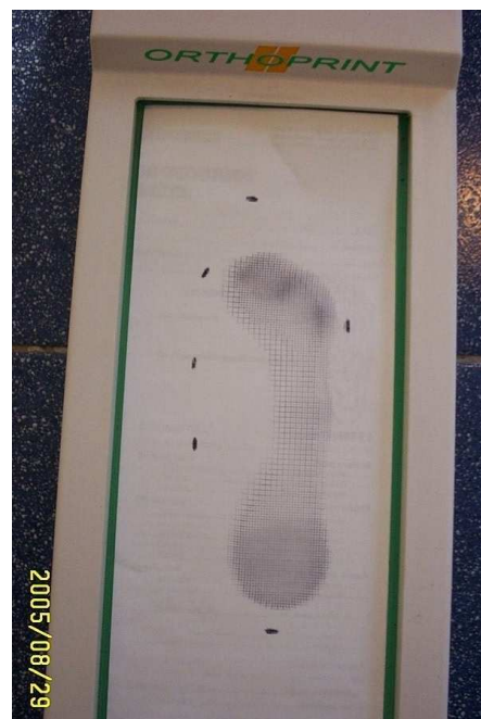
Tratamiento Fundas ortopodológicas pie diabético