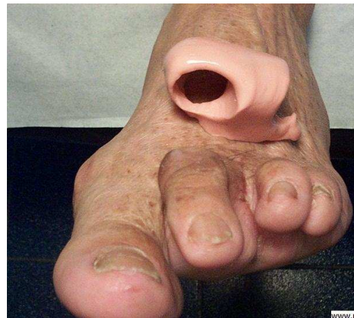
Tratamientos de Ortesis en Queratomas Interdigitales y Ortejo Amputado