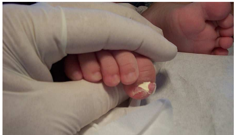
Tratamiento de urgencia podopediátrica