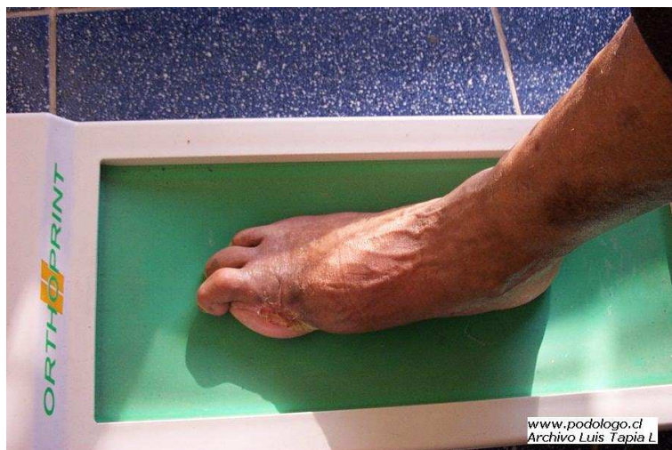
Impresión plantar para tratamiento podológico